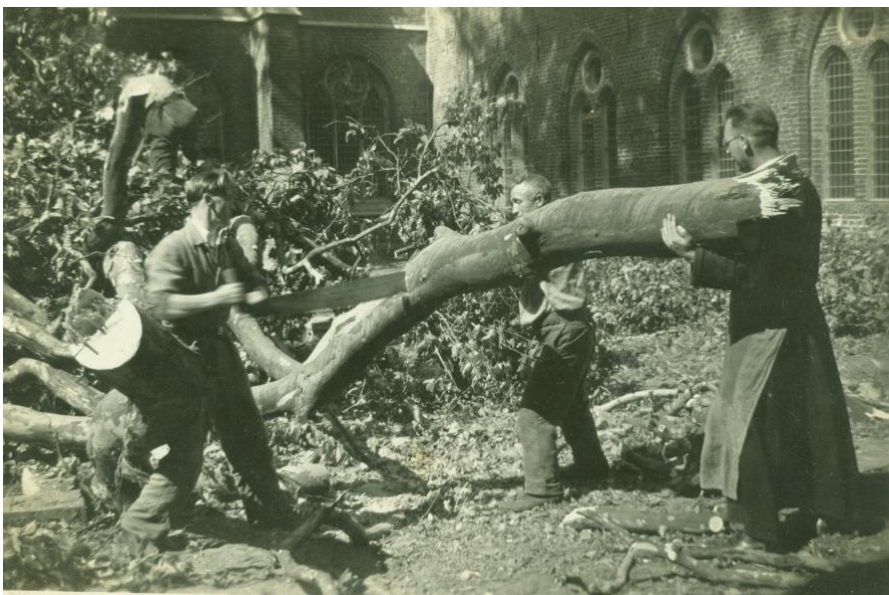
Op de achterkant staat geschreven: 1947 verhaal na 50 jaar nog bekend bij jonge paters. Wim en Corrie Weijtmans hebben deze nog gesproken. 3 weken aan gewerkt door in de kost te gaan bij de paters.

Uiteindelijk was de stam aan de beurt, maar deze was nog zo groot dat men nog stukken uit het kozijn moest zagen om de stam naar buiten te krijgen. Het laatste stuk is het bloot graven van de wortels en de wortels loshakken van de stam zodat ook de stronk kon worden verwijderd.