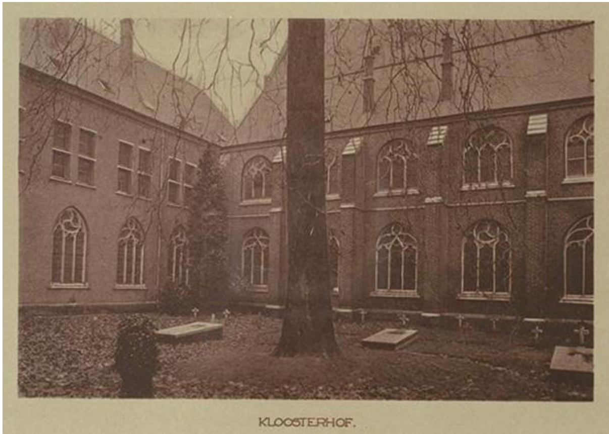
Het kloosterhof op de binnenplaats van het klooster en daaromheen liggend de graven.

Uiteindelijk was de stam aan de beurt, maar deze was nog zo groot dat men nog stukken uit het kozijn moest zagen om de stam naar buiten te krijgen. Het laatste stuk is het bloot graven van de wortels en de wortels loshakken van de stam zodat ook de stronk kon worden verwijderd.