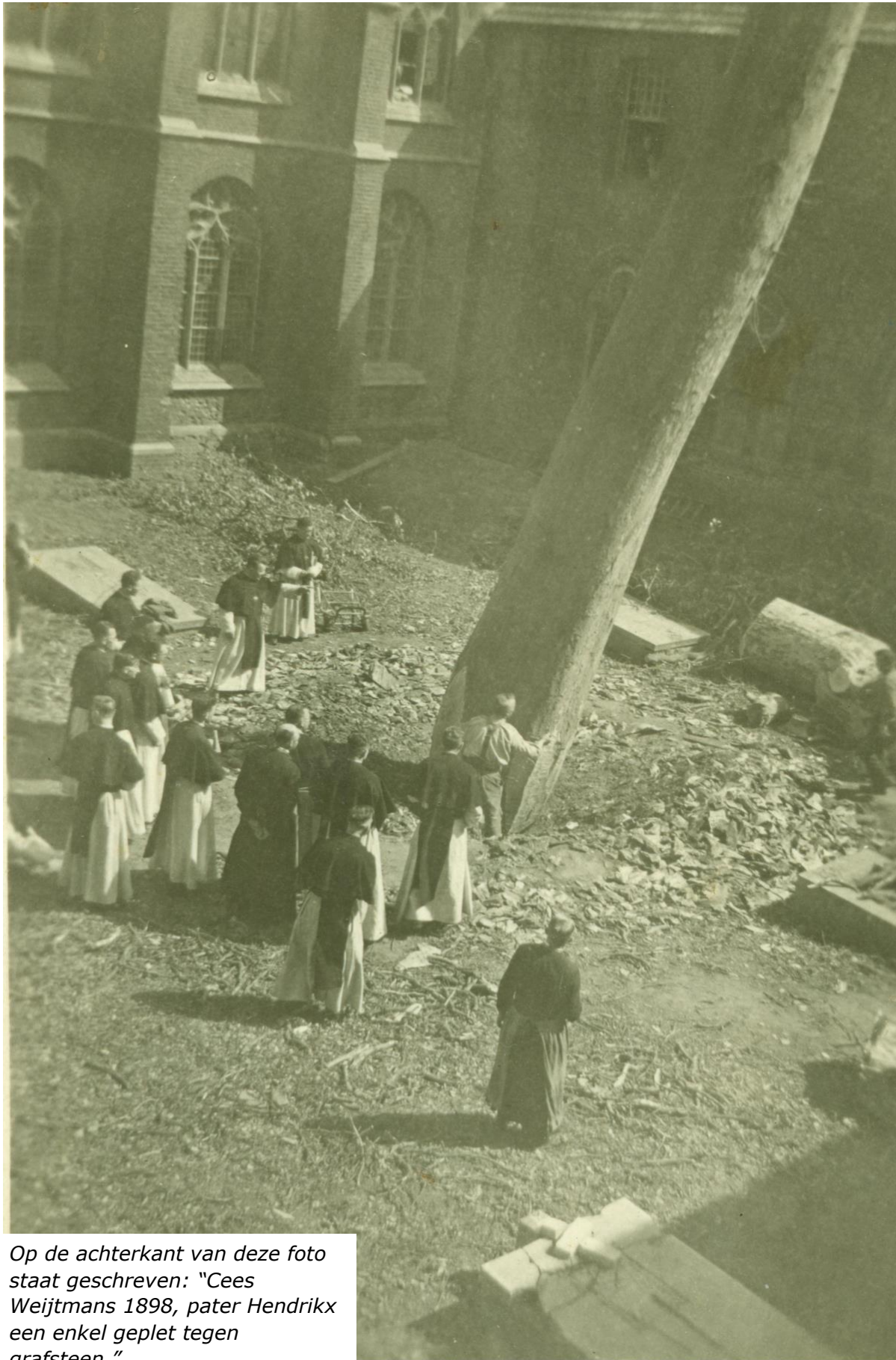
Op de achterkant van deze foto staat geschreven: "Cees Weijtmans 1898, pater Hendrixx een enkel geplet tegen grafsteen."