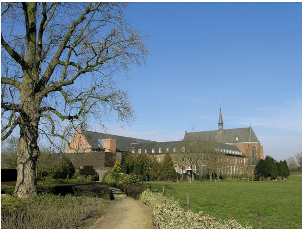
Het klooster in deze tijd, zonder de authentieke plataan.